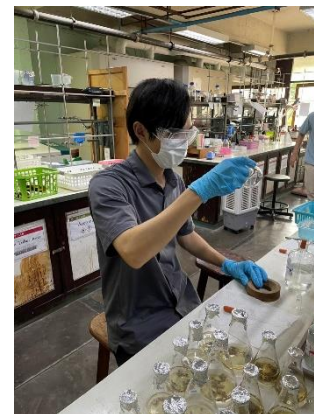
2023年9月7日 マヒドン大学理学部キャンパスツアー